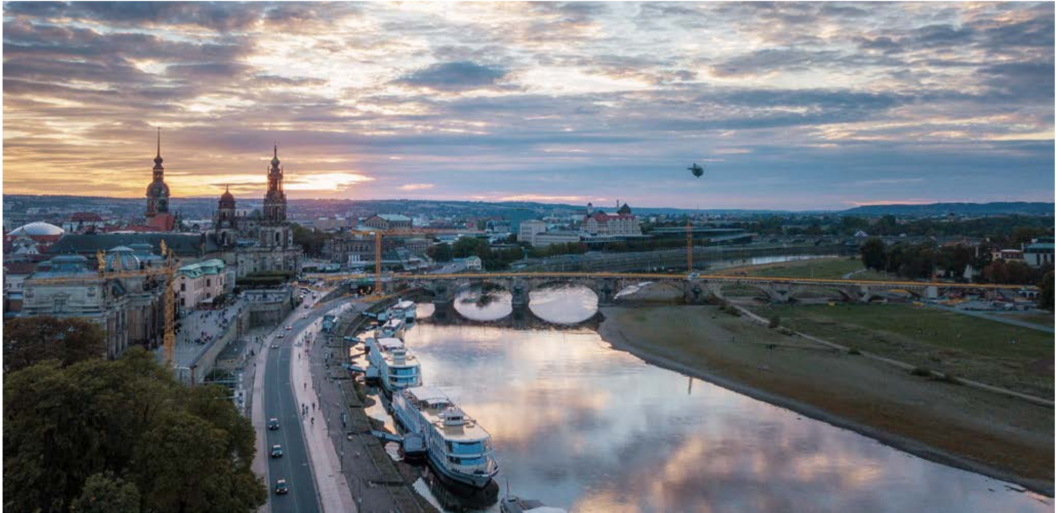
Dresden; Nils Eisfeld