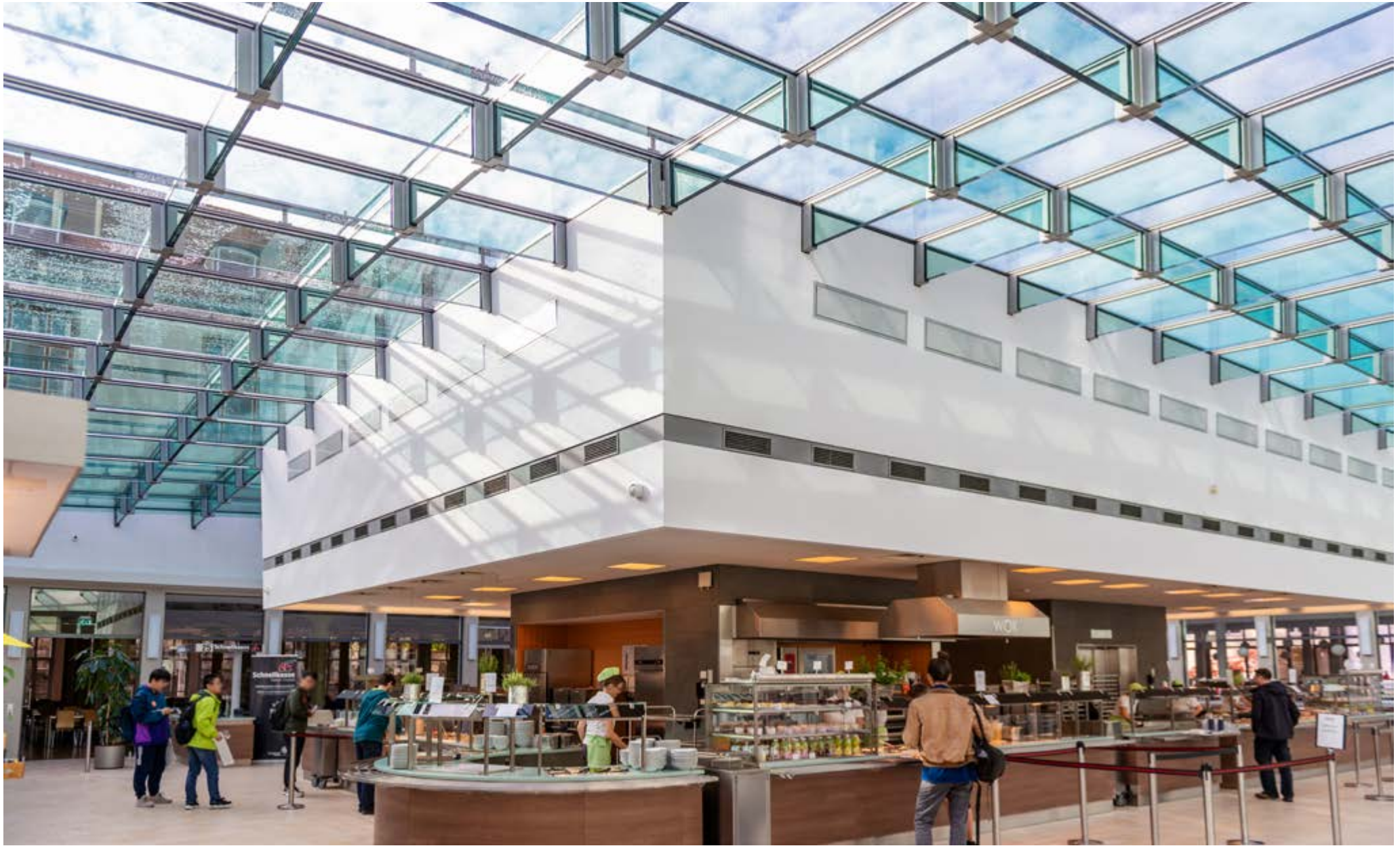
Bild S.12: Hörsaalzentrum Bild oben: Mensa TU Dresden