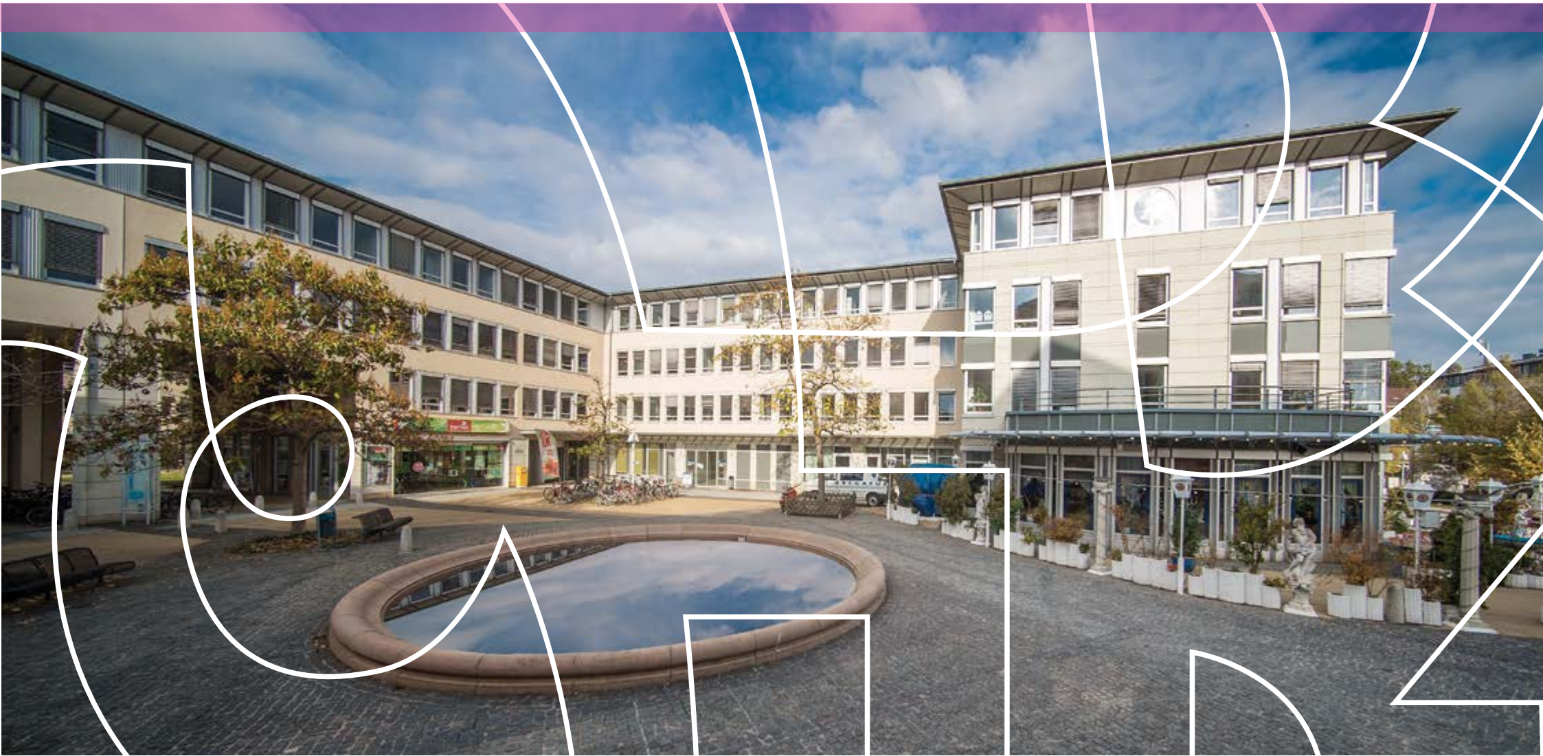
Falkenbrunnen; Institut für Soziologie