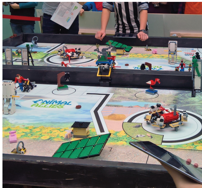
Landesverband Sächsischer Jugendbildungswerke e.V