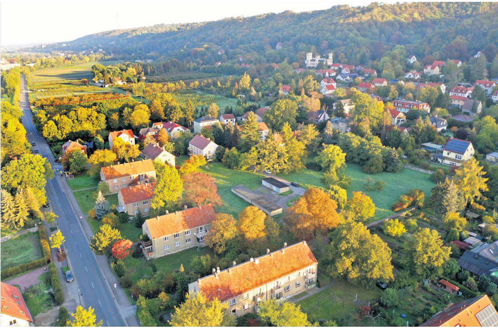
Energetische Modernisierung der bestehenden Bausubstanz, neue Heizanlagen, die ausschließlich regenerative Energie nutzen, und ressourcenschonender Neubau von kommunalem Wohnraum - dieses Gebäudeensemble in Dresden-Hosterwitz wird im Rahmen des EU-Projekts NeutralPath klimaneutral.