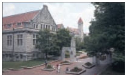
Blick auf den alten Campus der University Indiana, Bloomington.

Die nun vertraglich untermauerte Kooperation soll sich in den nächsten fünf Jahren insbesondere auf die Themen datenintensives Rechnen, verteilte Dateisysteme