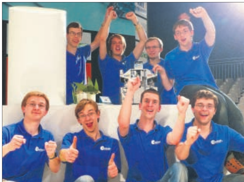
Das TURAG-Team freut sich über die gelungene WM-Teilnahme.

Im Viertelfinale gegen das italienische Team (späterer Vizeweltmeister) fuhr »Elefant«, der bis dahin zuverlässig Türme