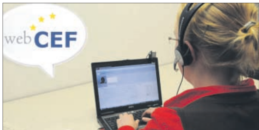
WebCEF ist eines der E-learning-Projekte derTUD.

Monatlich finden Flashmeetings statt, d. h. virtuelle Videokonferenzen mittels WebCam und Mikrofon, bei denen sich die Projektpartner aus den verschiedenen Län-