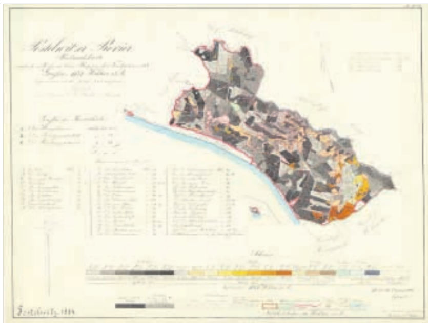
Forstbestandskarte des Reviers Postelwitz in der Sächsischen Schweiz von 1884.