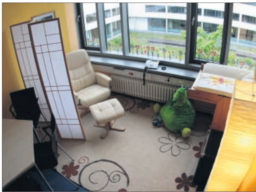
Die farbenfrohe Ruheinsel für junge Eltern.

Damit ist jungen Müttern (oder Vätern) im BIOTEC und CRTD die Möglichkeit eröffnet, die Arbeit an zeitlich eng gefassten Projekten mit den elterlichen Aufgaben in einem farbenfrohen, beruhigten Bereich zu vereinbaren. Das