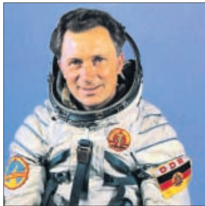
Als einer der Referenten spricht der erste Deutsche im All, Sigmund Jähn.

Als Neil Armstrong 1969 als erster Mensch den Mond betrat, hielt die Welt den Atem an. Millionen von Fernsehzuschauern waren live dabei, als das scheinbar Unmögliche möglich wurde und ein Menschheitsraum in Erfüllung ging. Auch 40 Jahre danach ist die Faszination der Raumfahrt ungebrochen und viele junge Menschen entscheiden sich für ein Studium der einschlägigen Fächer.