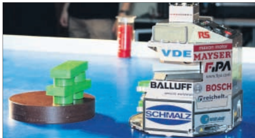
Der Roboter »Elefant« baut am Tempel.