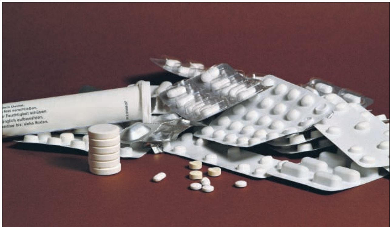
Wenn Gesunde auf Arbeit Medikamente nehmen, die sie nicht benötigen, liegt der Verdacht auf Doping nahe.