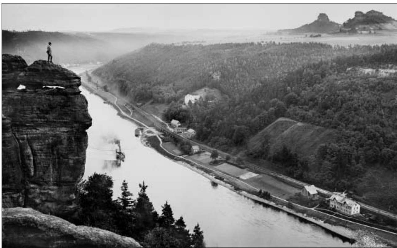
Fotografien der Sächsischen Schweiz von Walter Hahn (1889 – 1996) sind seit 12. Juni und bis zum 4. Oktober 2009 im Stadtmuseum Pirna zu sehen. Die exzellenten Bilder entstanden in der Zeit von 1911 bis 1938 bei ausgedehnten Wanderungen und Kletterpartien. Ab den 1920er Jahren machte Walter Hahn auch Aufnahmen aus der Luft, um die charakteristischen Landschaftsstrukturen der Sächsischen Schweiz abzulichten. Die Sonderausstellung im Stadtmuseum Pirna, 01796 Pirna, Klosterhof 2, ist täglich – außer montags – von 10 bis 17 Uhr geöffnet. JS, Repro: Stadtmuseum Pirna