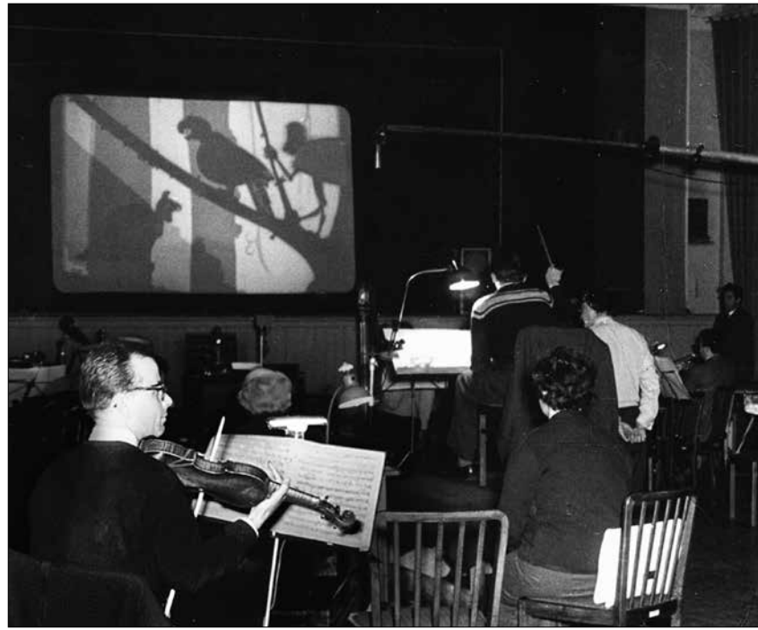
Tonaufnahmen zu »Warum jeder ein Körnchen Weisheit besitzt« (Bruno J. Böttge, 1959) im DEFA-Tonstudio in Gittersee.

Rätz, 1981) angewählt werden. Durch eigene Gestaltung des Tons ist zu erfahren, wie stark der Klang die Filmbilder beeinflusst. Nadja Rademacher/UJ