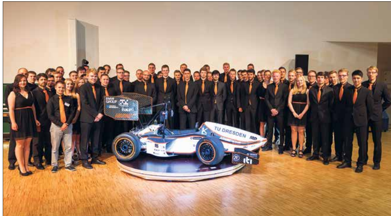
Der große Moment für das gesamte »Elbflorace«-Team: Sie präsentieren ihren neuen Flitzer »LucE« per »Roll Out«.

Die von der Commerzbank AG gestifteten Preise wurden zum 19. Mal vergeben. Seit 18 Jahren wird der Dr.-Walter-Seipp-Preis aus dem gleichnamigen Fonds der Commerzbank-Stiftung an besonders herausragende Dissertationen von jungen Nachwuchswissenschaftlern der TU Dresden verliehen.