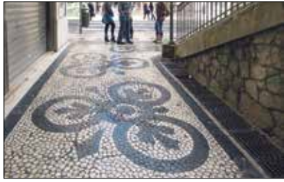
Dieses Motiv aus der Exposition wurde in Lissabon aufgenommen.