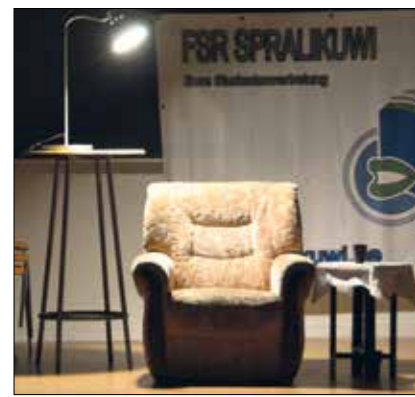
Ein Buch, ein Sessel, ein Vorleser – so wird es am 1. Juli mehrfach zu erleben sein.

nen Genres, Epochen und von unterschiedlichen Literaten vorgestellt zu bekommen, von zeitlosen Klassikern wie Kafka zu modernen Autoren wie Haruki Murakami, von »Die Pest« bis »Der Krapfen auf dem Sims«, von Fantasy bis Satire wird bei »Lies vor!« alles vorkommen. Dabei stolpert die eine oder der andere sicher über ein Buch, das man im Buchladen niemals auch nur in die Hand genommen hätte! Es werden während der Veranstaltung alle Bücher möglichst im vorgelesenen Original zur Verfügung stehen, um den Einband zu bestaunen oder den Klappentext oder die vorgestellte Stelle nachzulesen. Zwischen dem vielen